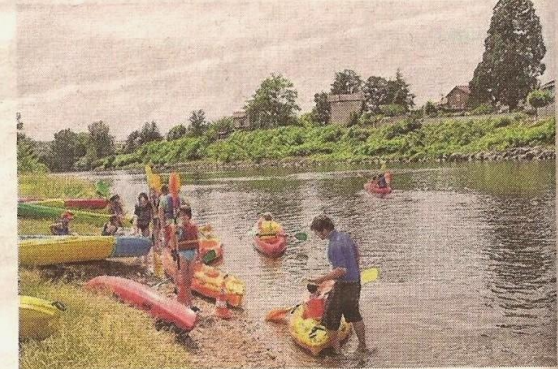
■ Le public est attendu nombreux dimanche pour essayer le canoë-kayak.

L'après-midi, des baptêmes de kayak en eau calme seront proposés devant la base de loisirs.