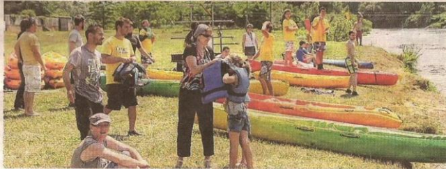
■ En partenariat avec l'organisation des Mercredis de l'été, la Base de Loisirs mettra à disposition son matériel, entre 15 et 18 heures, pour découvrir le kayak sur la Loire.

La nuit de 22 juillet s'est préparée autour du pop, du rock et du blues. Trois groupes au répertoire varié se succéderont sur scène ce soir-là : les Dusty Groove, The Blockbusters Blues Band et les Doors-fall. Ils se produisent en partenariat avec l'association