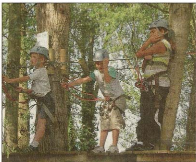
Léger embouteillage dans les arbres de l'accrobranche