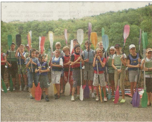
Avec le beau temps, l'activité kayak a eu un vif succès